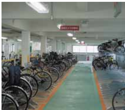
誰もが利用しやすい施設に

はできるだけ出入り口に近い駐輪スペースを案内するとともに、状況に応じて駐輪ラックへの乗せ降ろしの介助を行っている。今後さらに進行する高齢社会を踏まえ、関係機関と連携して駐輪場の利便性の向上に取り組んでいきたい。なお、明石駅前の再開発ビル内には、500台規模のバリアフリー化した駐輪場の設置を予定している。また、自転車版の高齢者マークを配布することについても、先進事例を参考にしながら、導入に向けて取り組んでいきたいと考えている。