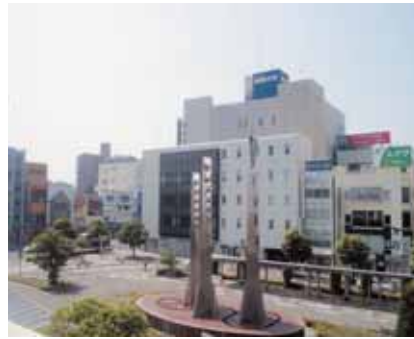
中心市街地全体を活性化へ

問 現在、明石駅前南地区の再開発事業が進められているが、平成13年に東仲ノ町地区の再開発事業で誕生したアスパア明石との相乗効果をもたらす駅周辺の未来像について聞